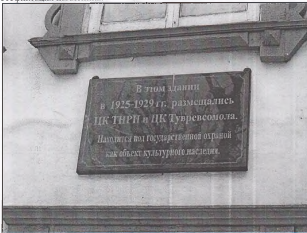
1. Информационная надпись